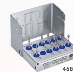
4686ST PVP Perfect Veneer Preparation