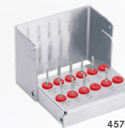
4573ST Expertenset für Keramikkronen