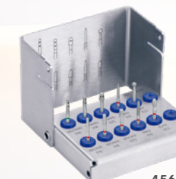
4562ST Expertenset für Keramikinlays und Teilkronen