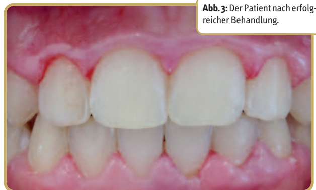
Abb. 3: Der Patient nach erfolgreicher Behandlung.