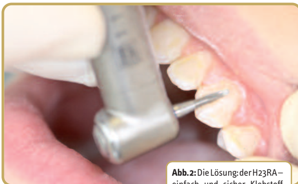
Abb. 2: Die Lösung: der H23RA – einfach und sicher Klebstoff entfernen.

Vestibulär greife ich zum Klebstoffentferner H23RA (Abb. 2 und 4). Wer das Instrument zum ersten Mal in den Händen hält, wird merken, dass es ein komplett neues Arbeitsgefühl vermittelt. Der H23RA ist aggressiver als herkömmliche Klebstoffentferner, der Materialabtrag erfolgt sehr schnell und eher modellierend, ohne den sonst üblichen Widerstand. Hierdurch erweist er sich besonders bei der Entfernung von großen Kleberrückständen als sehr hilfreich.