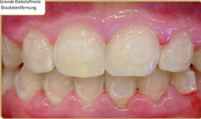
Abb. 1: Störende Klebstoffreste nach der Bracketentfernung.