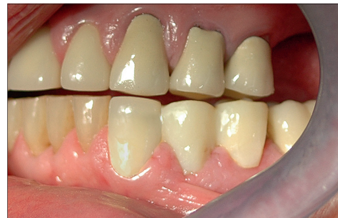
Abb. 3: Mit einer guten „Provi“ werden auch die anspruchsvollsten Patienten zufriedengestellt.