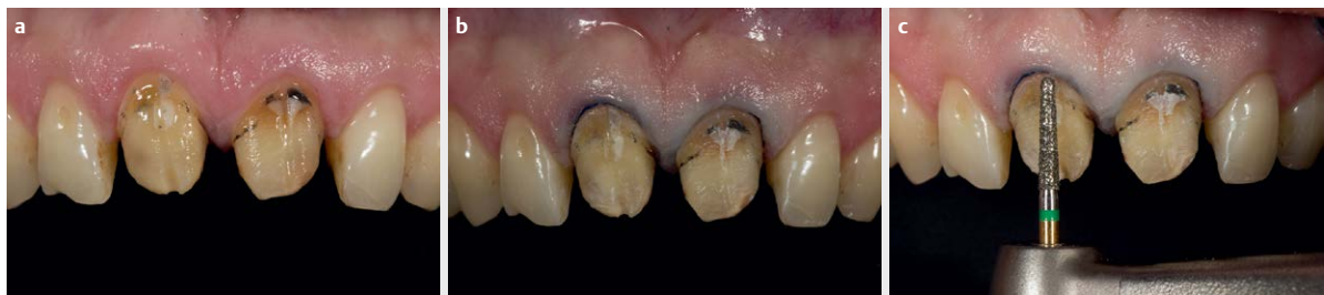
► Abb. 3 Nach Entfernen der vorhandenen Restaurationen wird ein Retraktionsfaden zum Schutz der Weichgewebe platziert. Die Vorpräparation erfolgt mit einem grobkörnigen, vor Kopf runden, konischen Diamantinstrument.

Präparation durch den Luftstrom der Hochvakuumabsaugung austrocknen. Da dies zu einer Aufhellung führt, zeigt eine Farbnahme am Ende der Präparation ein verfälschtes Ergebnis (► Abb. 2 ).