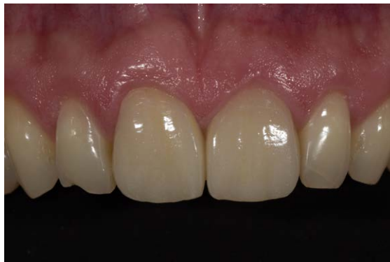
► Abb. 8 Farblich in der Maltechnik individualisierte und adhäsiv eingegliederte Frontzahnkronen.

Kronen gepresst. Die farbliche Individualisierung erfolgte dann in der Maltechnik mit den geeigneten Malfarben in einem Mal- und einem Glasurbrand. Abschließend wurde die Restauration mit einer Diamantpolierpaste final poliert.