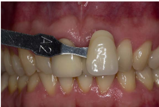
► Abb. 2 Zahnfarbbestimmung vor Beginn der Präparation. Die Zähne sind in dieser Phase noch nicht ausgetrocknet.