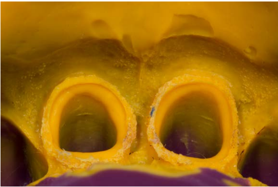
► Abb. 5 Abformung mit einem additionsvernetzenden Polyvinylsiloxanmaterial in der Doppelmischtechnik.

latinalen Flächen ein minimaler Abtrag von 1 mm zu fordern. Die Übergänge von der axialen zur inzisalen Kante und den palatinalen Flächen wurden zudem werkstoffgerecht gerundet.