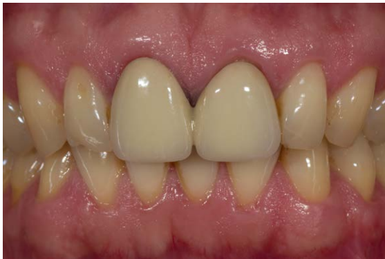
► Abb. 1 Insuffiziente, verblockte metallkeramische Kronen auf den beiden mittleren Schneidezähnen.

Ein 39-jähriger Patient stellte sich mit 2 insuffizienten metallkeramischen Kronen auf den beiden mittleren Frontzähnen vor (► Abb. 1 ). Die Neuversorgung sollte mit monolithischen vollkeramischen Restaurationen aus einer neu entwickelten zirkonoxidverstärkten Lithiumsilikat-Keramik (ZLS) erfolgen. Diese bereits seit mehreren Jahren für die CAD/CAM-Technologie verfügbare Materialgruppe bietet neben einer hohen Dauerfestigkeit und guten optischen Eigenschaften auch den Vorteil einer einfachen Polierbarkeit [2, 8–10]. Seit kurzem sind diese Materialien im be-