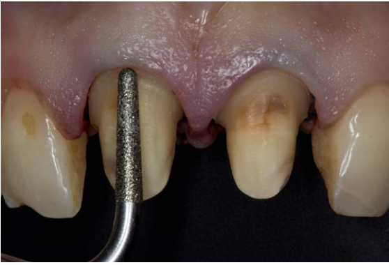
► Abb. 4 Die finale Präparation erfolgt dann mit einer zum rotierenden Diamantinstrument formkongruenten Schallspitze (SF856.000.018, Komet Dental, Lemgo) nach Applikation eines 2. Retraktionsfadens.