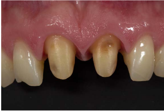
► Abb. 6 Klinische Situation 2 Wochen nach der Präparation mit perfekt ausgeheiltem Weichgewebe.