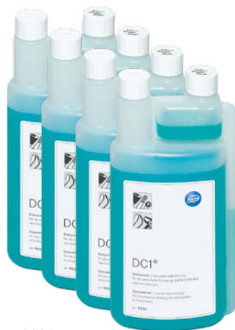
9826 (4 x 1 л в удобных канистрах с дозатором)