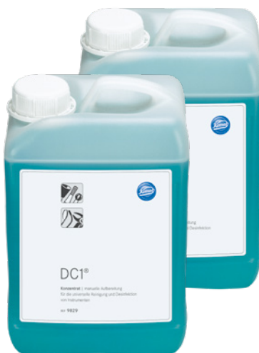
9829 (Двойная упаковка 2 x 3 л)